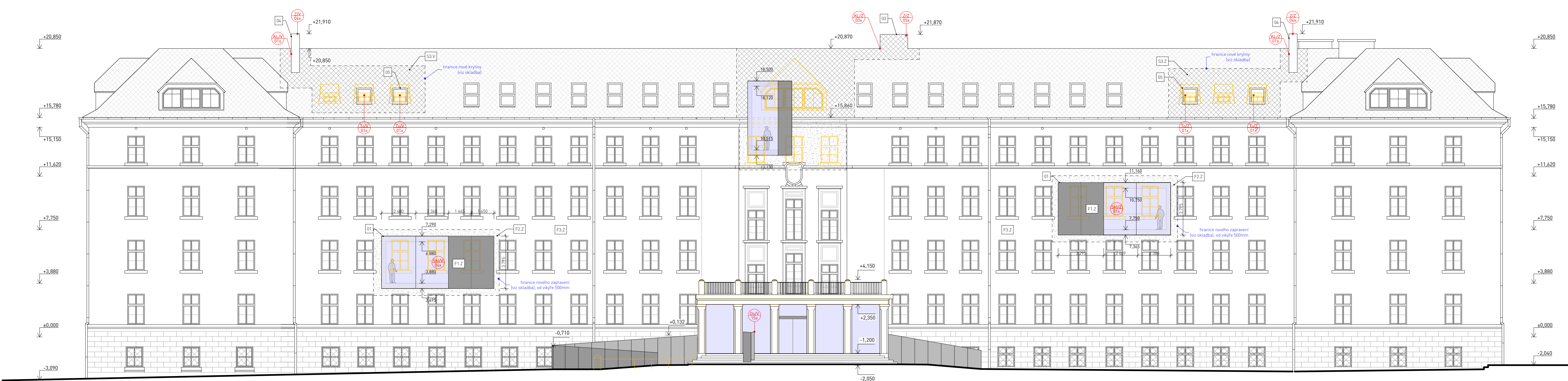
pohled - stávající stav / bourání